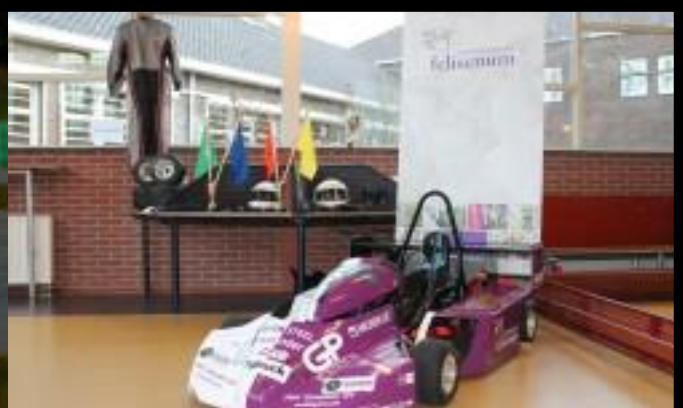
De kart op de opendag van het Felisenum