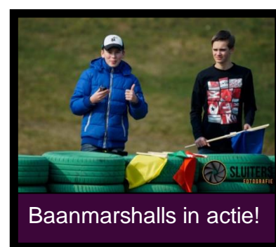
Baanmarshalls in actie!