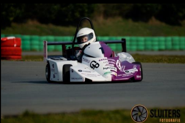
De kart op de Testdag in Assen