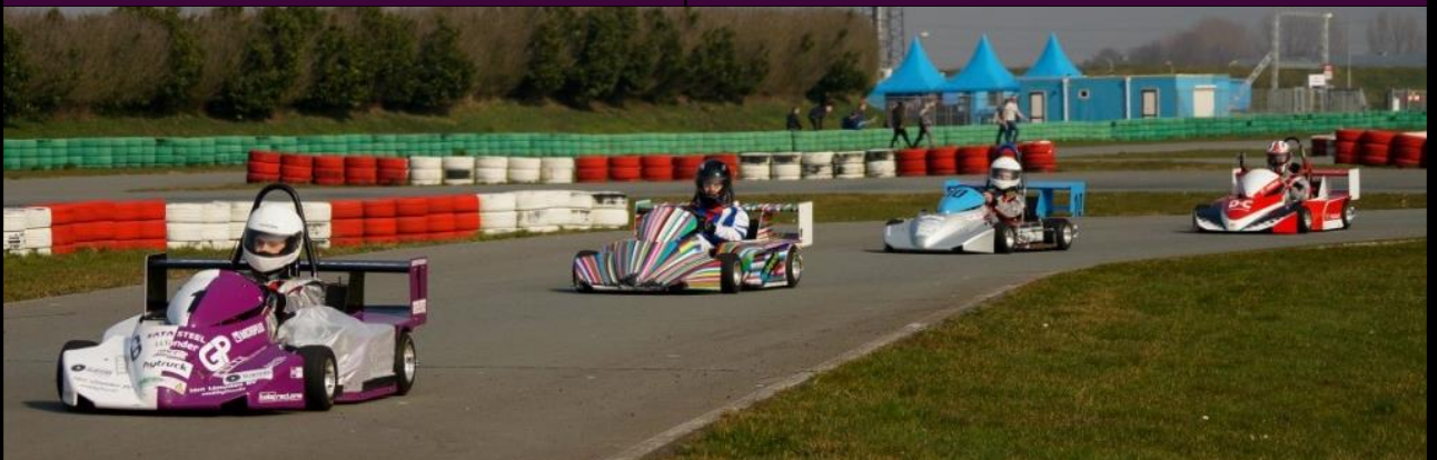
De karts op de testdag in Assen