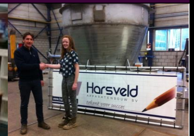
Harsveld sponsoort goud!