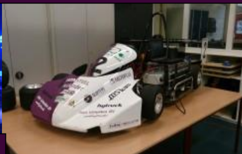
De kart op de opendag van het TCV