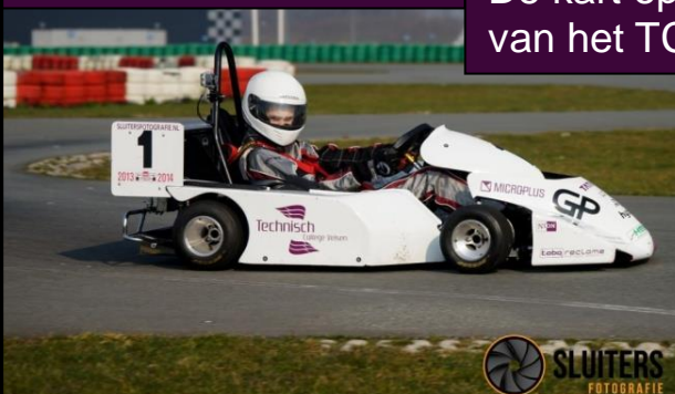
Actie foto van de kart op de testdag

Superkart Team Velsen Twee scholen, Één team!